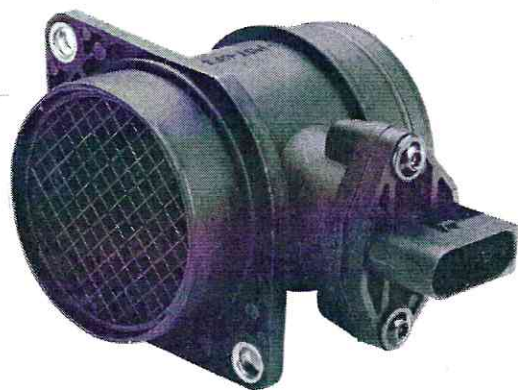
Рисунок № 2.